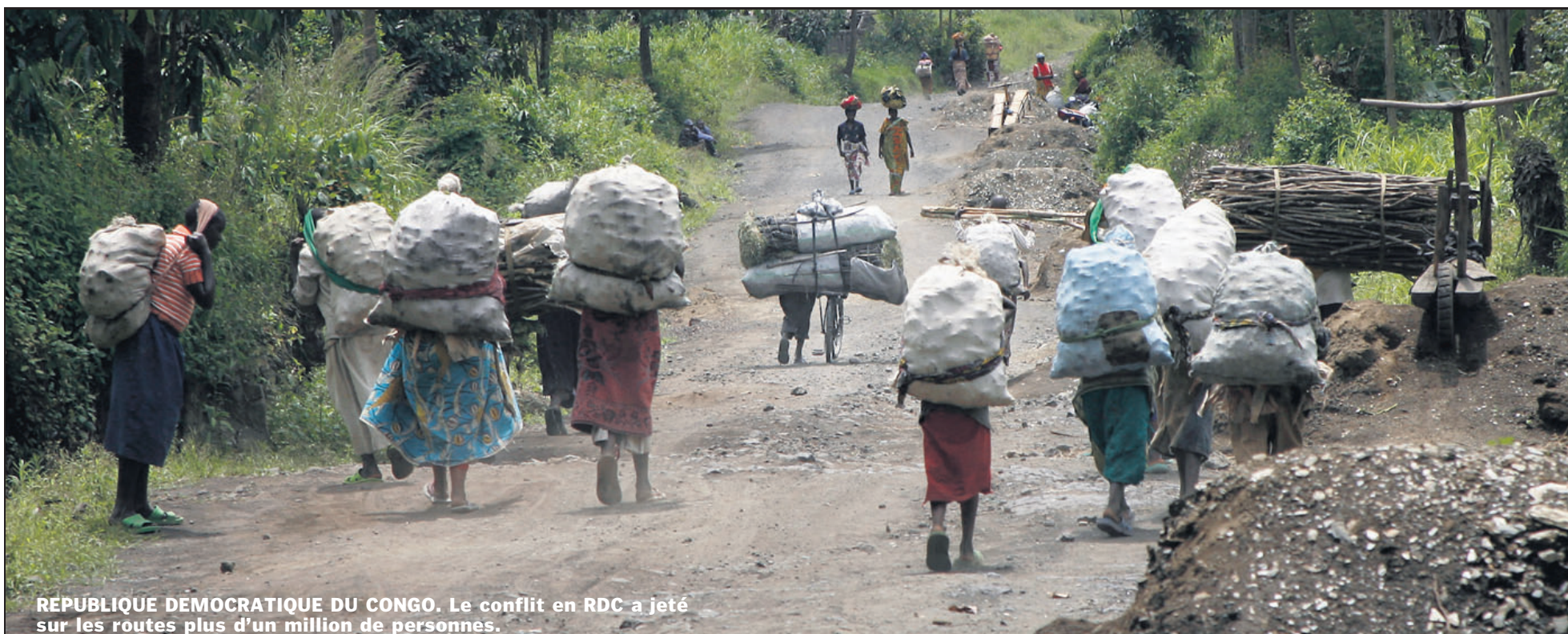
REPUBLIQUE DEMOCRATIQUE DU CONGO. Le conflit en RDC a jeté sur les routes plus d'un million de personnes.