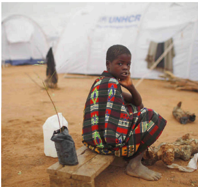
Un réfugié somalien au camp de Dadaab (est du Kenya), le 28 juillet.

La famine se propage en Somalie, rendant indispensable l'amplification de l'aide internationale